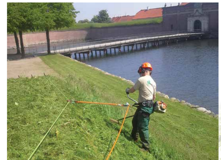
Grøn pleje af skråningerne på Kronborg.

Se flere eksempler på vores arbejde på hjemmesiden.