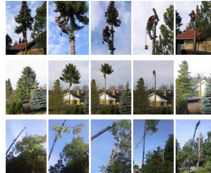
Sektionsfældning af problemtræer med og uden mobilkran.