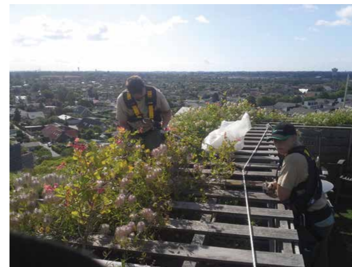
Lugning på ydersiden af tagterrasser er en specialopgave. Den løser vi.